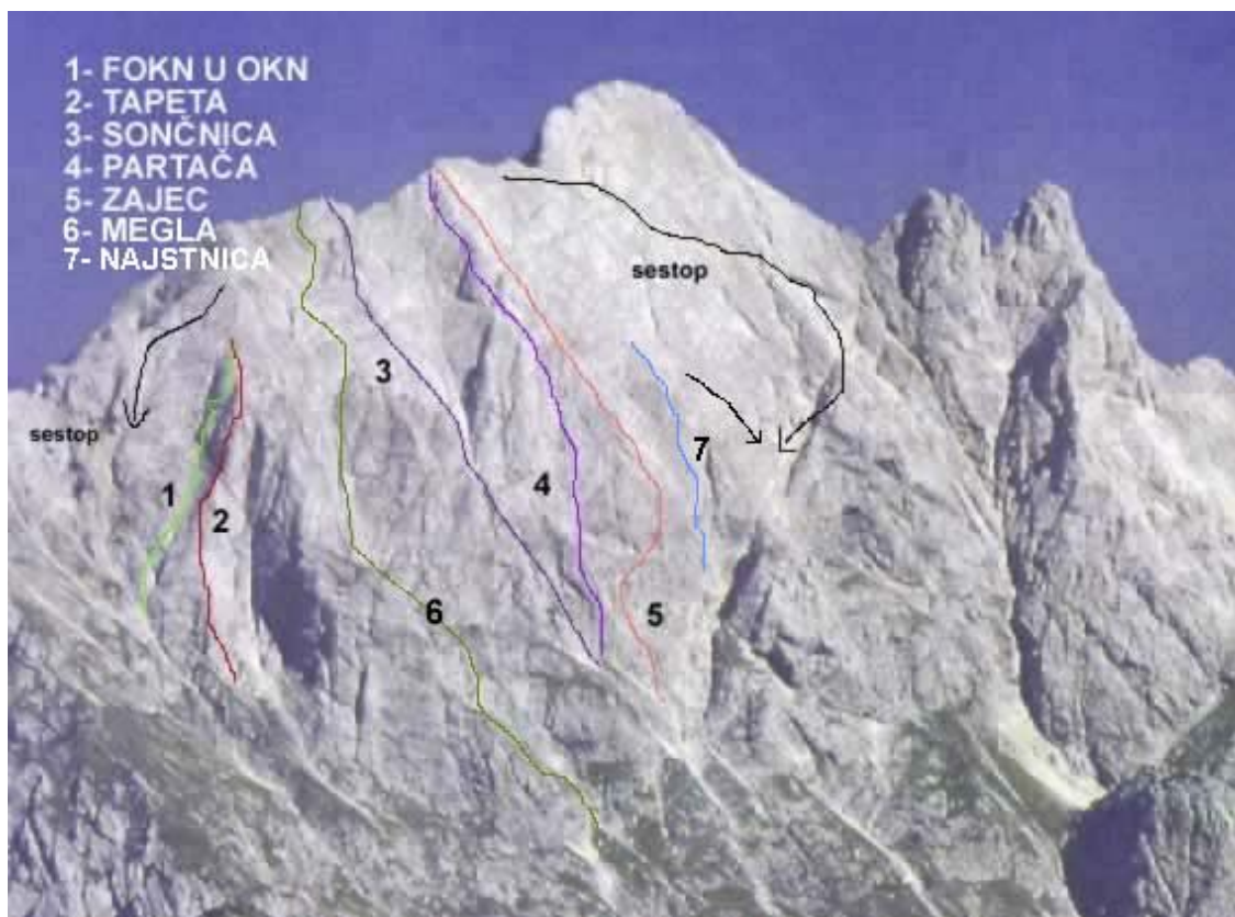
Prisank, južna stena: 1 Fokn u okn, 2 Tapeta, 3 Sončnica, 4 Partača, 5 Zajec, 6 Megla, 7 Najstnica.