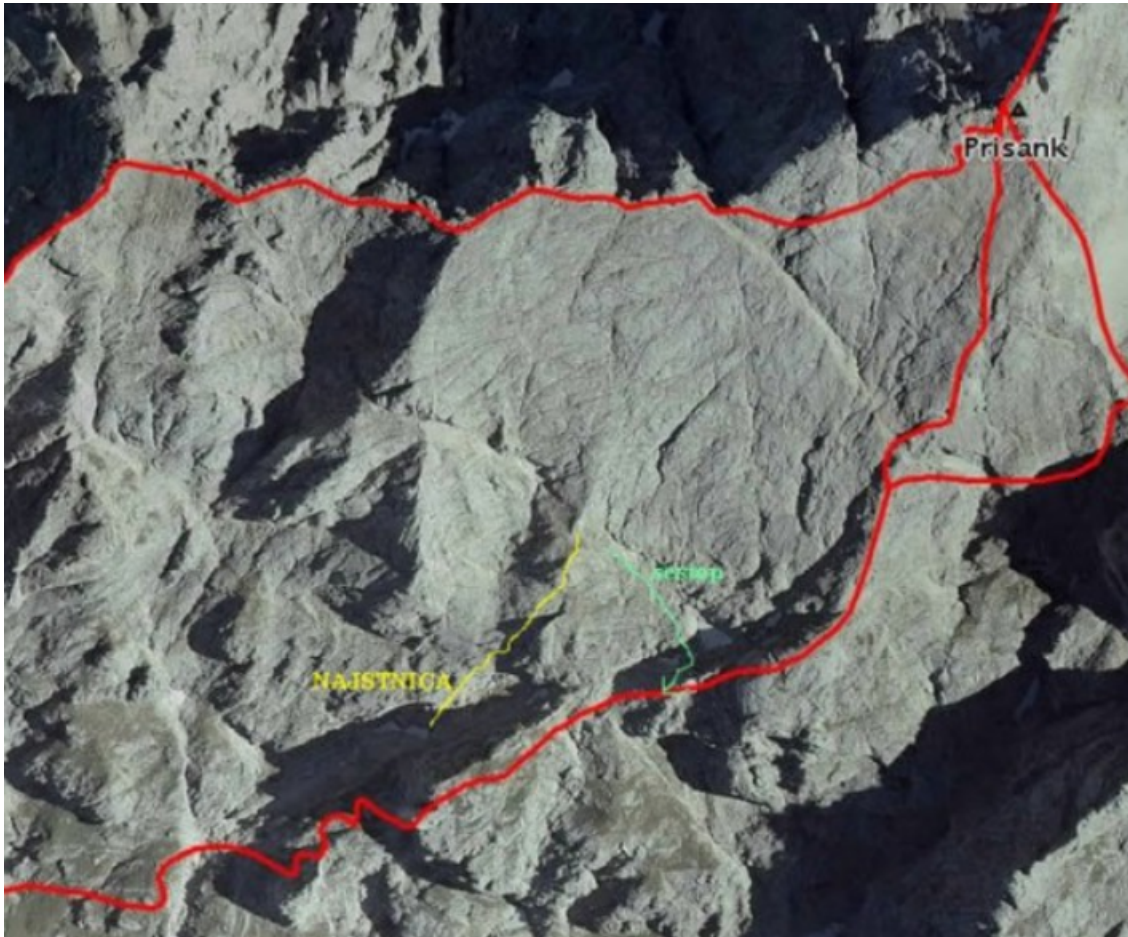
Prisank, južna stena: Najstnica.