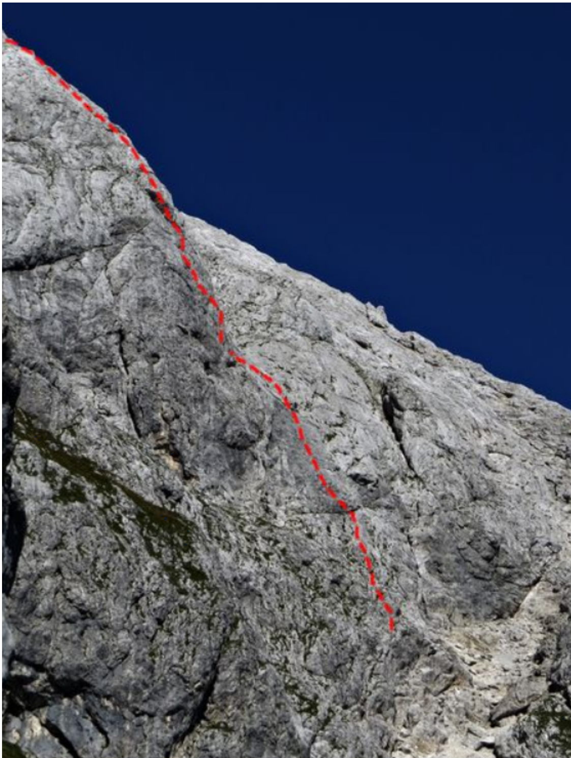
Prisank, južna stena: Zvok tišine.