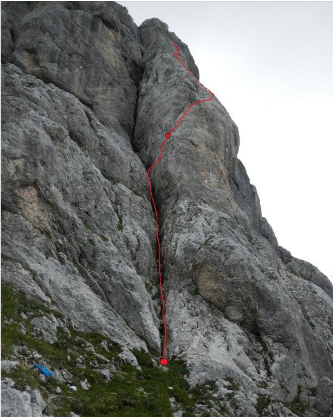
smer letečih klinov_foto1