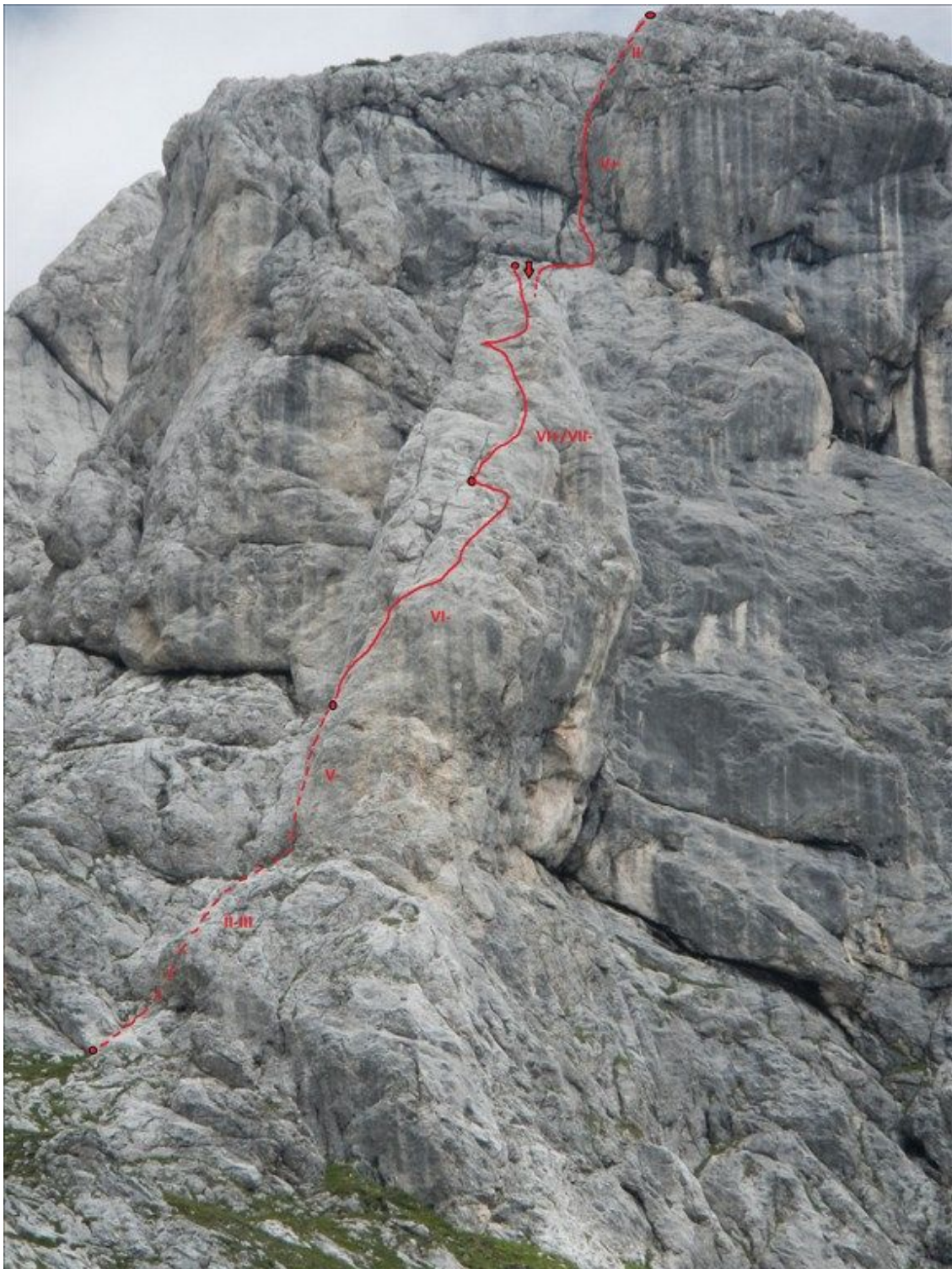
smer letečih klinov_foto