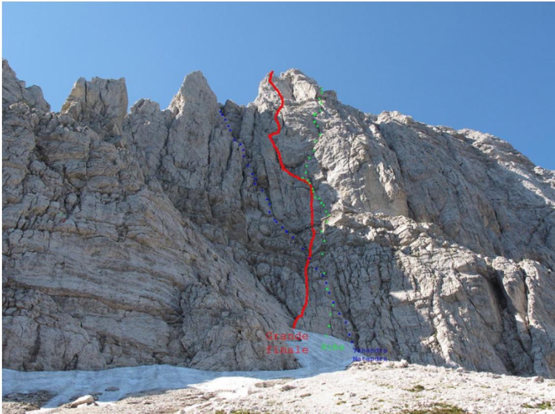
Nad Šitom glava, severna stena: Grande finale (rdeča), Riba (rumena), Tandara-Mandara (modra).