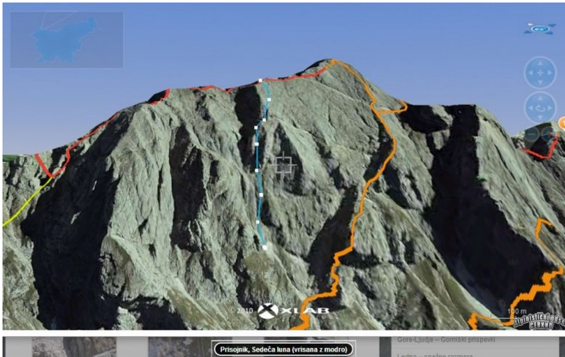
Sedeča luna modra