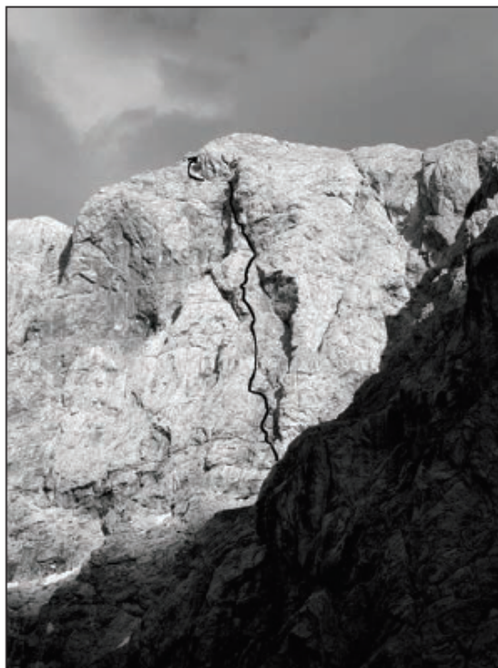
Gal v galeriji