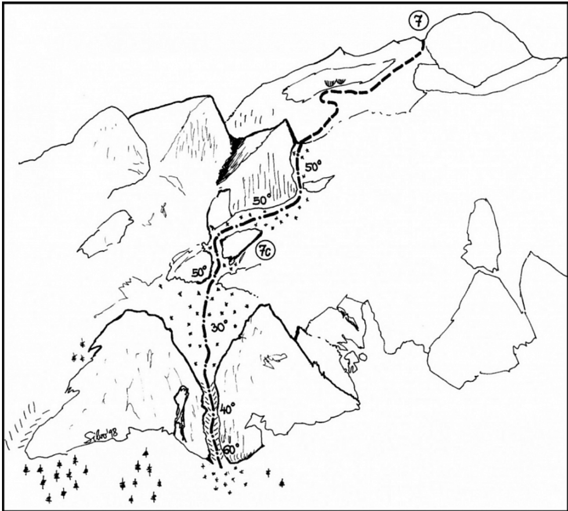
Turska gora: 7 Tschadova smer, 7c Bela piramida.