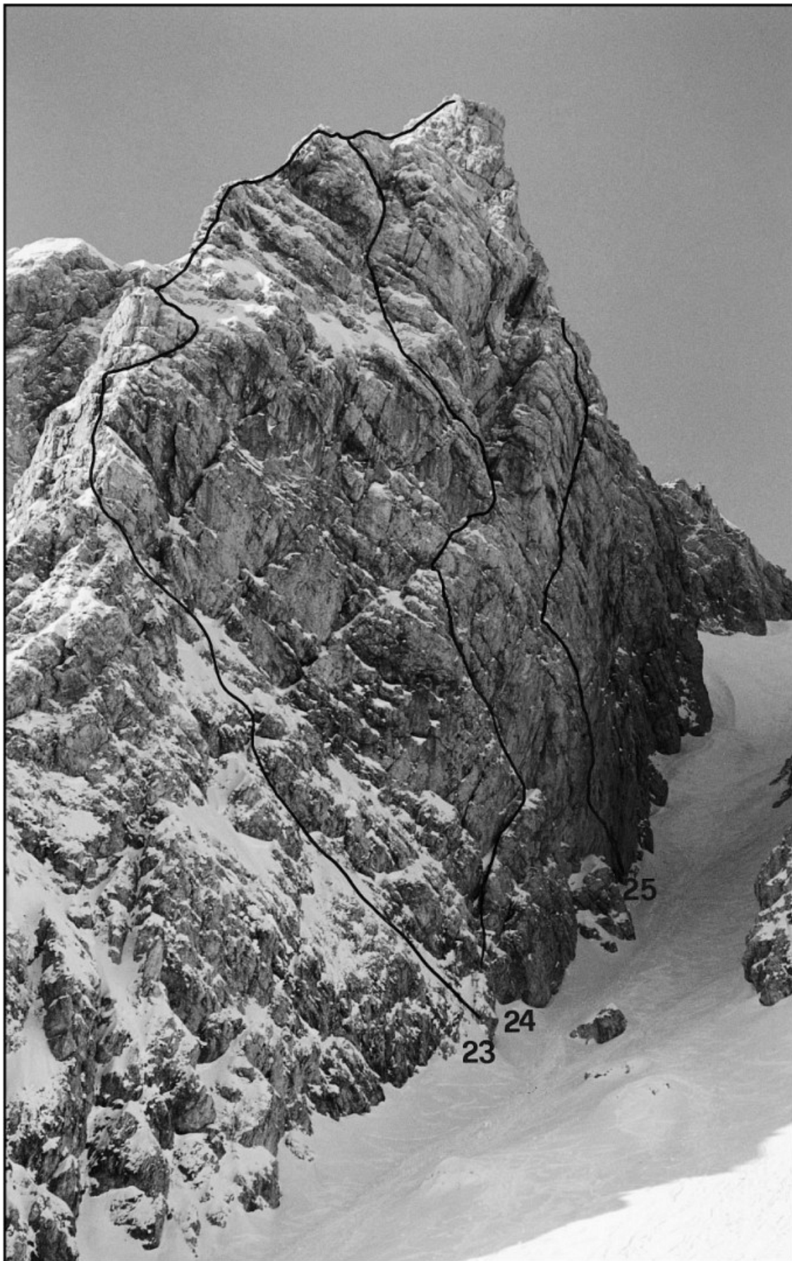
Turska gora: 23 Szalay-Gerinov greben, 24 Pahljača, 25 Smer Kotnik-Verko.