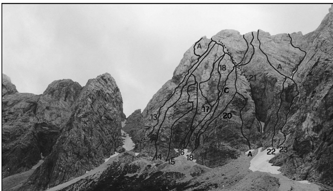
Mala Rinka: 13 Vzhodna smer, 14 Direktna smer, 15 Marjetica, 16 Zreška smer, 17 Igličeva smer, 17C Debeljakova varianta, 18 Nos, 20 Smer Zupančič-Wisjak, 20A Varianta Kočevar-Muck, 21 Žrelo, 22 Mali tačko, 23 Celjska smer, 23A Varianta čez plošče.