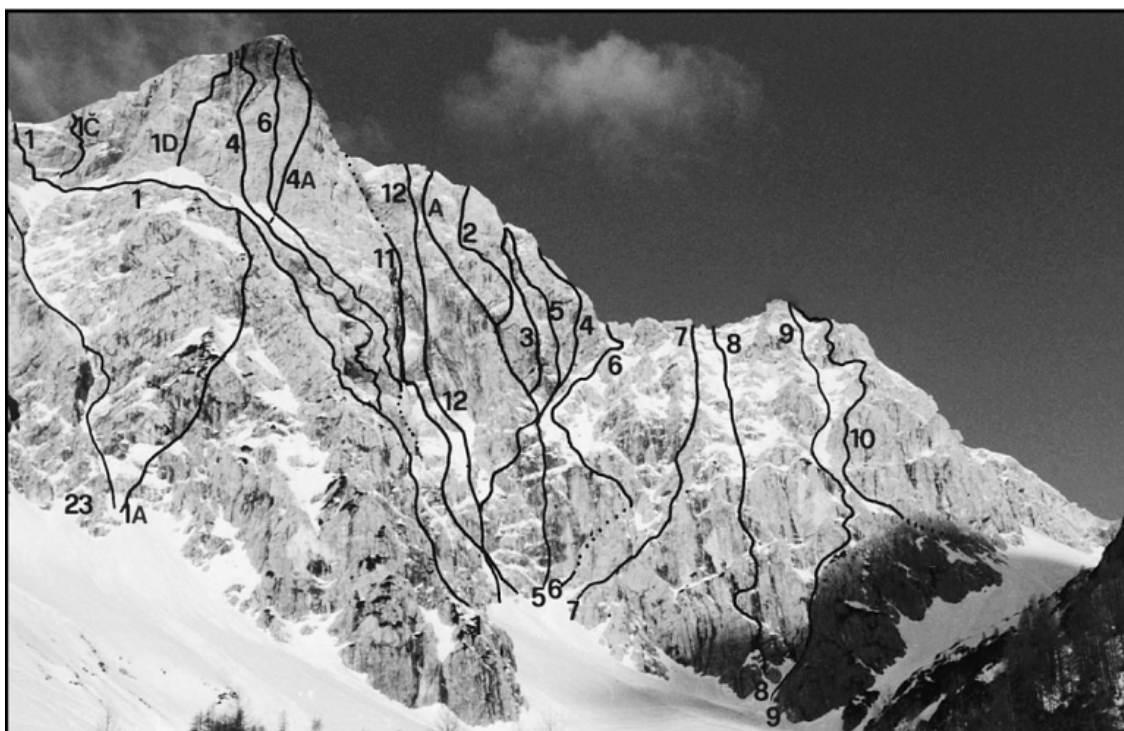
Mala Rinka: 21 Žrelo, 22 Mali tačko, 23 Celjska smer. ŠTAJERSKA RINKA: 1A Leva vstopna varianta Stebra Štajerske Rinke, 1 Steber Štajerske Rinke, 1Č Izstopna varianta Knez-Stopinšek, 1D Desna izstopna varianta, 4 Direktna smer, 4A Desni izstop, 6 Spominska Bregarjeva smer, 11 Ledenka, 12 Rumena pod mornica. KOROŠKA RINKA ALI KRIŽ: 2A Varianta Antloga-Plausteiner, 2 Vzhodni steber, 3 Zajeda, 4 Slovenjebistriška smer, 5 Paradižnik, 6 Vzhodna smer, 7 Petelinji raz, 8 Smer