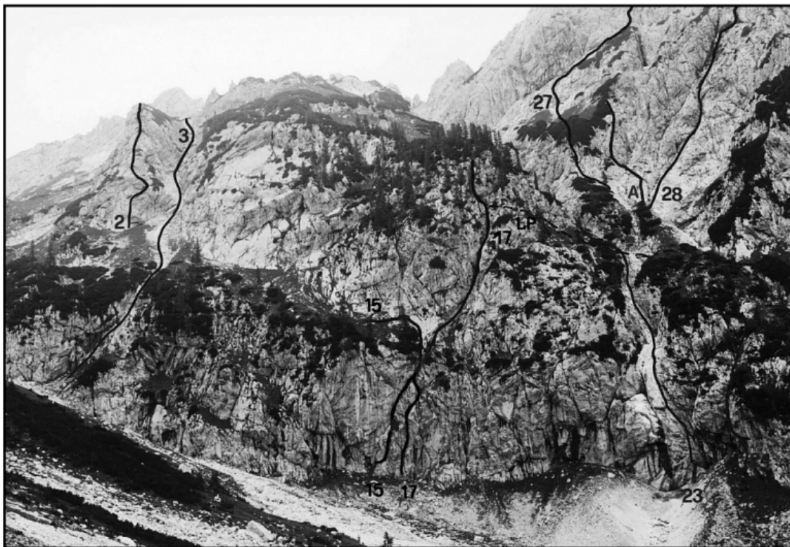
Mrzla gora: 2 Pajkova mreža, 3 Dopoldanska grapa, 15 Miš-maš, 17 Smer slovesa, 27 Fotografška, 27A Oktobrska revolucija, 28 Zahodna smer, LP lovska pot.