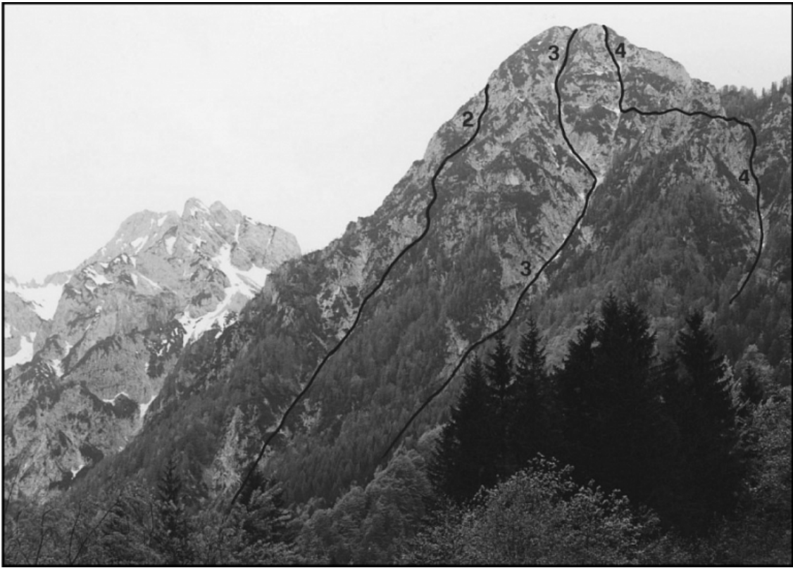
Matkova kopa: 2 Leva smer, 3 Centralna grapa, 4 Sestopna grapa.