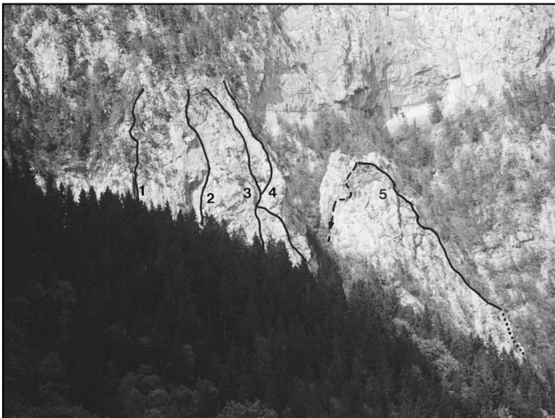
Jameljska peč: 1 Travnata zajedna, 2 Siga, 3 Lepi jeglič, 4 Desni raz, 5 Raz stolpa.