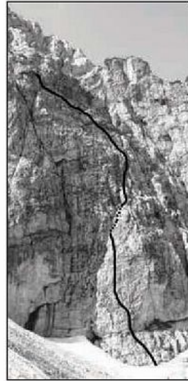
Mala Mojstrovka, severna stena: Poezija.