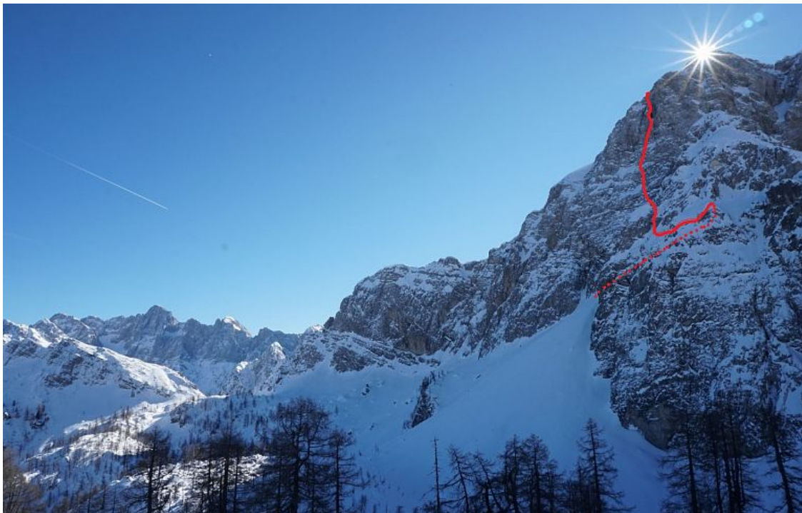
Mala Mojstrovka, severna stena: Vinkotova (vris).