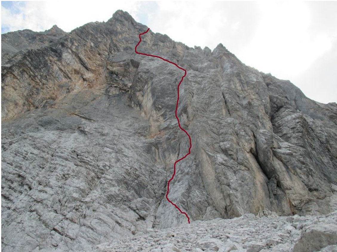
Široka peč, severna stena: Opium (vris).