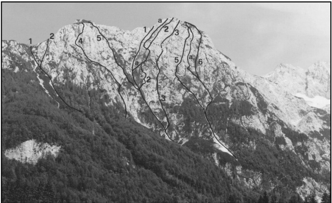
Mala Baba: 1 Ogledniška smer, 2 Minkin žleb, 4 Bertosova smer, 5 Grba. VELIKA BABA: 1 Spominska Viktorja Krèa, 1a Šolska varianta, 2 Silvotova, 3 Amfiteater, 5 Mik poševnega, 6 Samotna smer, 6a Iskanja.