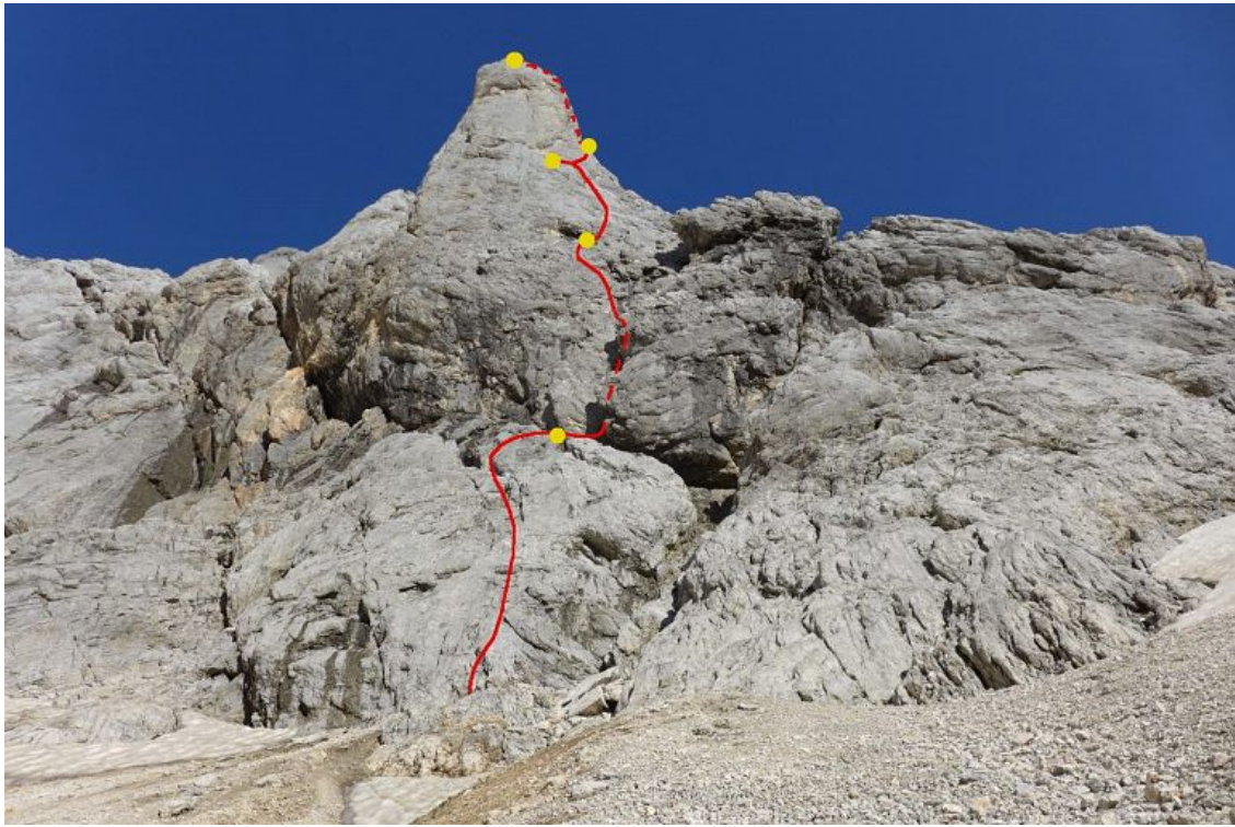
Oltarček, vzhodna stena: Indirektna (vris).