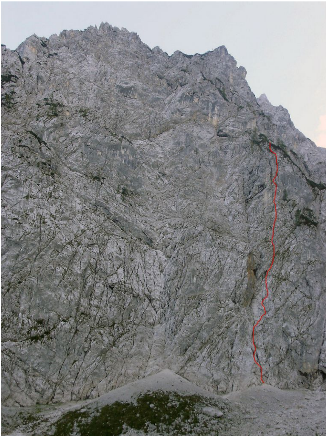
Vrh za stenami, severozahodna stena: Direktna nad srcem smer (vris).