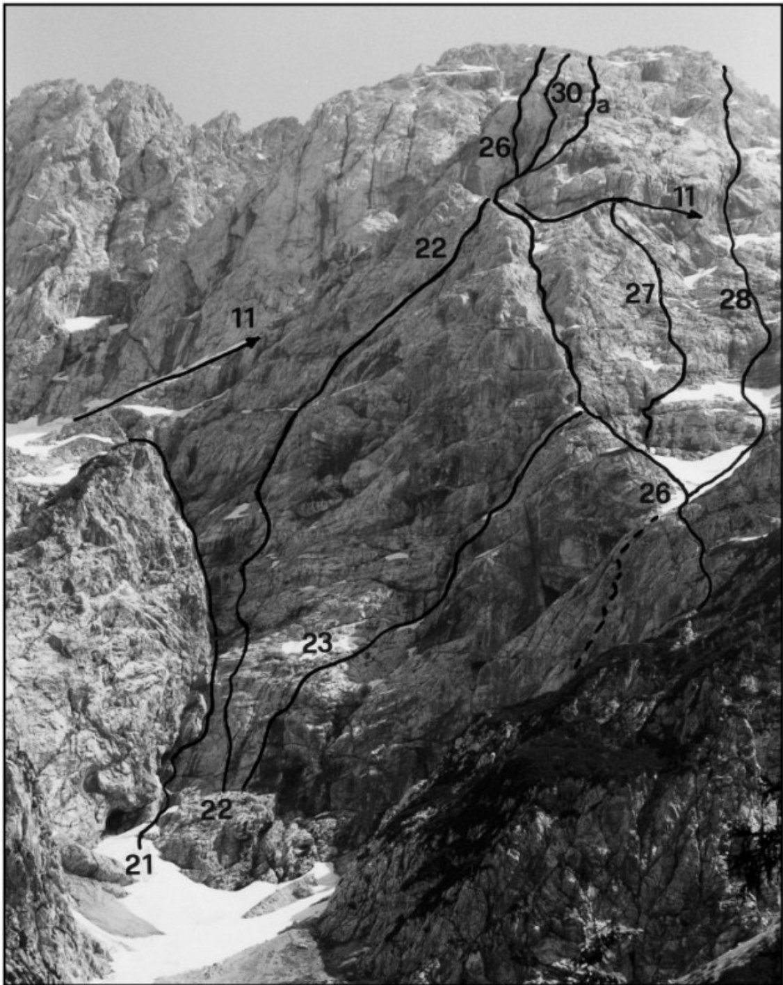
Dolgi Hrbet: 11 Prečenje severne in severozahodne stene, 21 Jeunesse 22 Gunceljjska, 23 Spominska smer Križnar-Škerl, 26 Smer Kemperle-Murovec, 27 Polžek, 28 Smer MM, 30 Vzhodna smer, 30a Varianta Vzhodne smeri.