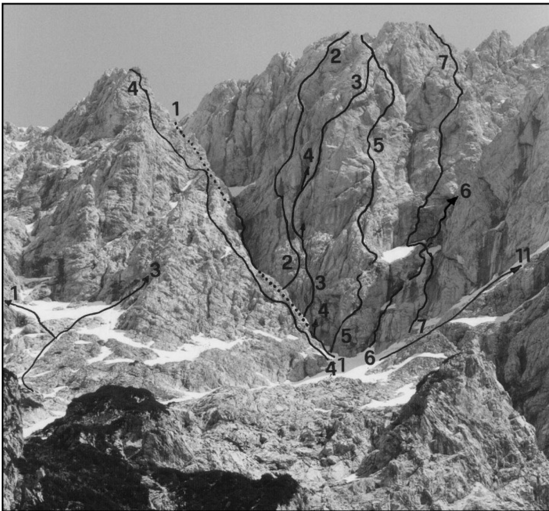
Štruca: 1 Vzhodna smer, 3 Zahodna smer, 4 Pomota. DOLGI HRBET: 1 Spominska smer Saše

navzgor v smeri razčlemb do krušljive, rdeče in plitve zajede. Po njej 7 m (V+), nato levo 4 m preko previsa (V-, k), pod streho. Prečnica pod streho in previsno ploščo v levo in preko majavih blokov (VI-) v kratek kamin ter po nekaj metrih na skalnat pomol (stojišče). Prestop desno in 20 m desno navzgor za skalnim robom, ter po zajedi do votline. Prečenje desno okoli roba 5 m (IV) in 10 m navzgor na stojišče kakih 20 m nad dnom žleba. 20 m rahlo levo navzgor v smeri plitve zajede, preko previsnega praga (IV) ter 10 m po prodišču nad gruščnato ramo (k, možic). Levo nad ploščami 12 m v kot pod previsi in 3 m navpično navzgor (V-, k) na poličko. 12 m desno po prekinjeni polički (V-, k), prečnica pod streho in prestop naravnost navzgor (V-, k) na stojišče. Nekoliko navzgor po razčlenjenem svetu, 2 m desno in 20 m navzgor po navpičnem belem razu iz trdne skale (IV+) na gruščnato stojišče (k). Štiri metre levo in po snežišču in kratkem žlebu rahlo desno navzgor do police. Po njej 20 m desno v žleb (sneg, 20-30 m nad robom velikega previsa v zajedi). Po 55° nagnjenem snegu 110 m, nato 20 m levo po gruščnati polici v lažji svet (10 m višje prereže žleb široka razpoka, 30 m nad njo pa ga zapira 50 m visoka stena). Po lahkem svetu do gruščnate grape, ki drži pod gladko zaporo v žlebu. Preko pragov (IV) na položen in gruščnat svet. Po njem 50 m na rob stene v majhno sedelce (možic).