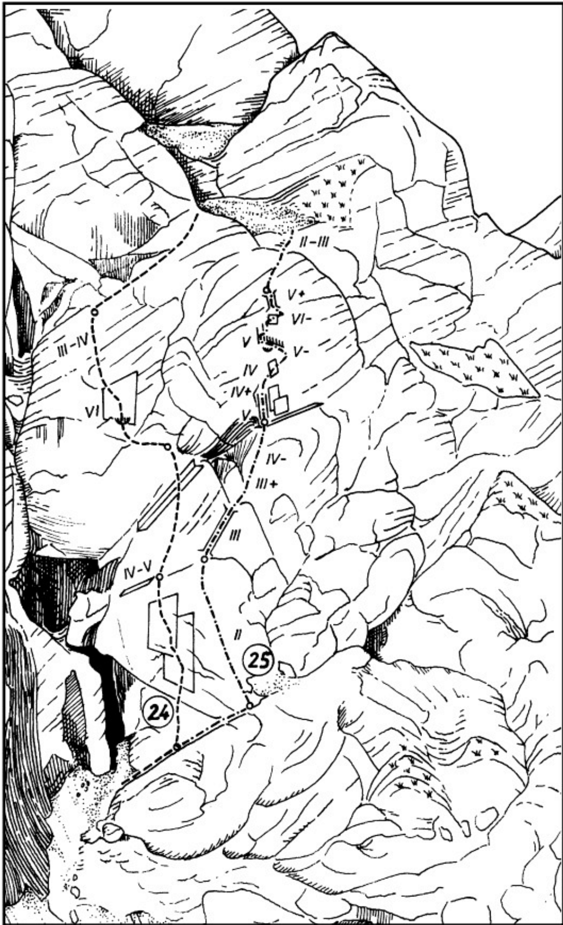
Dolgi Hrbet: 24 V spomin Roku, 25 Jesenski encijan.