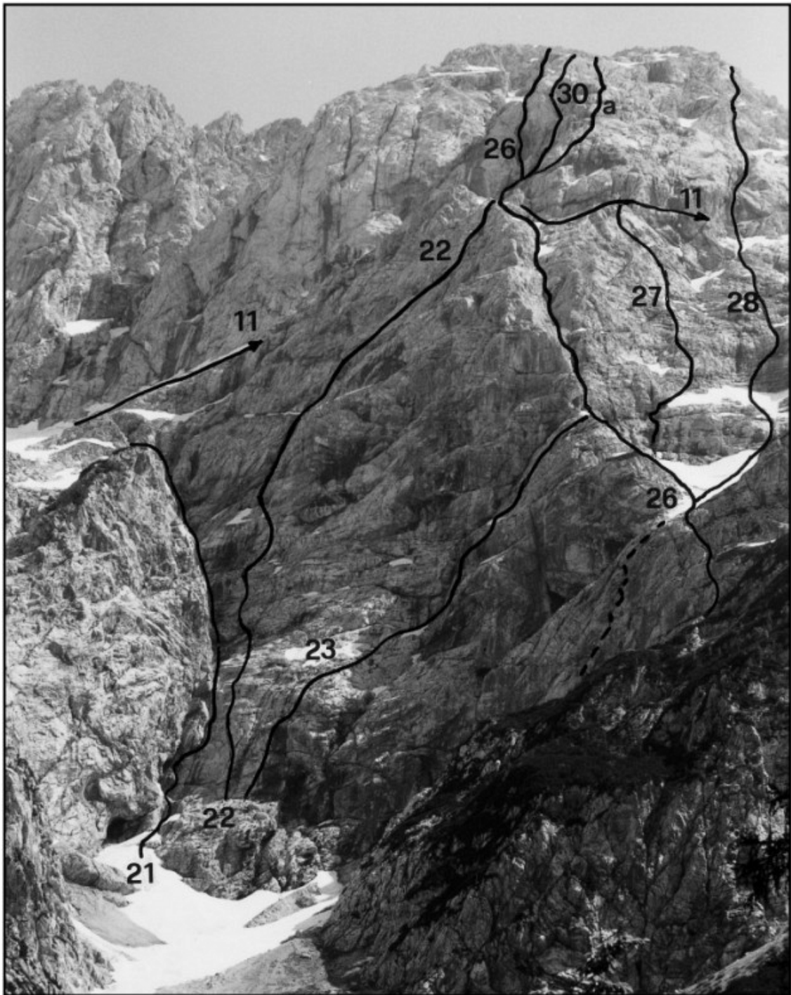
Dolgi Hrbet: 11 Prečenje severne in severozahodne stene, 21 Jeunesse 22 Gunceljska, 23 Spominska smer Križnar-Škerl, 26 Smer Kemperle-Murovec, 27 Polžek, 28 Smer MM, 30 Vzhodna smer, 30a Varianta Vzhodne smeri.