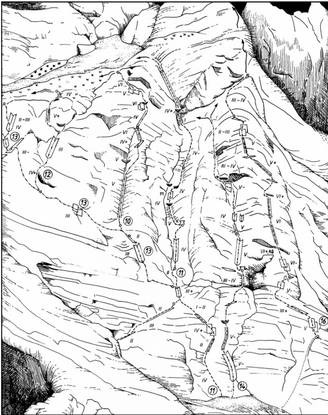
Grintovec: 10 Carmen, 11 Grintovčev steber, 12 Tanjina, 13 Gamsove police, 14 Zgrešena, 16 Beračica.