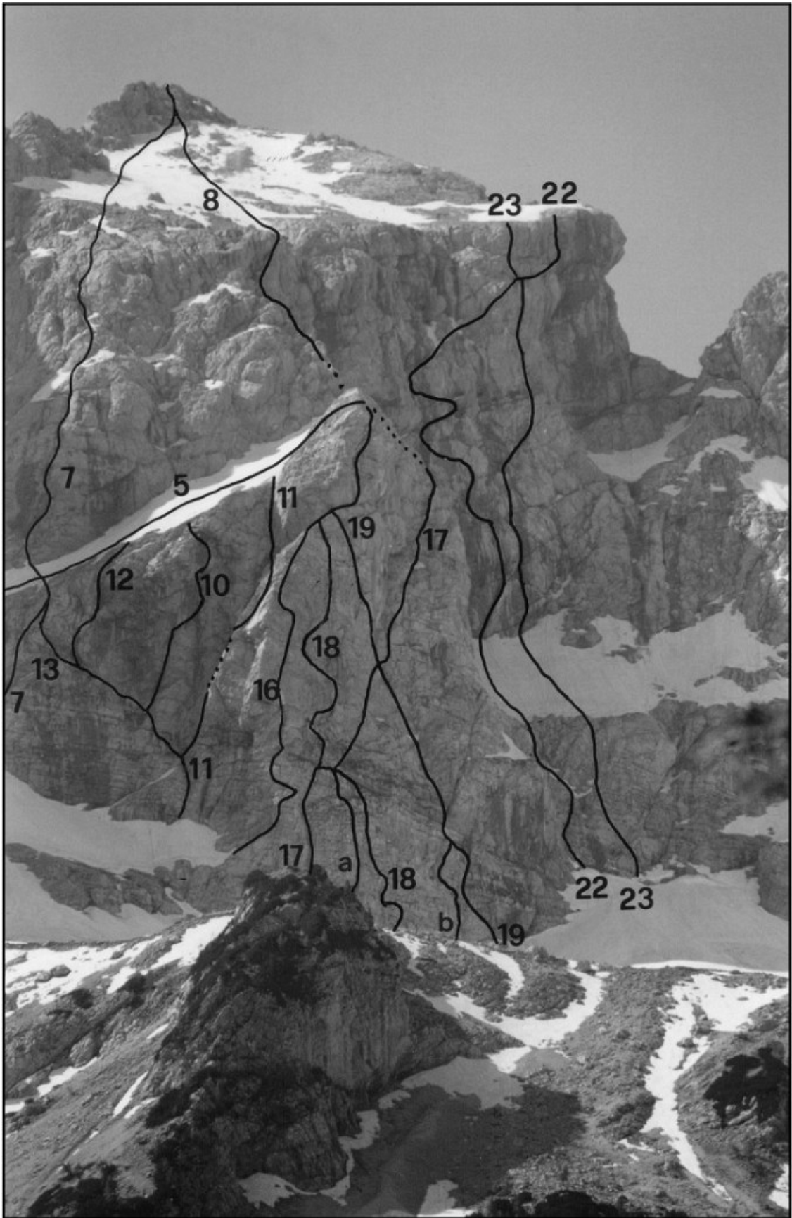
Grintovec: 5 Prečenje severne in severozahodne stene, 8 Smer Saar-Satler, 10 Carmen, 11 Grintovčev steber, 12 Tanjina, 16 Beračica, 17 Košutova spominska smer, 17a Ledena varianta, 17b Desna vstopna varianta, 18 Čarovnik iz Oza, 19 Tomažev steber, 22 Kovkov sindrom, 23 Konkubina.