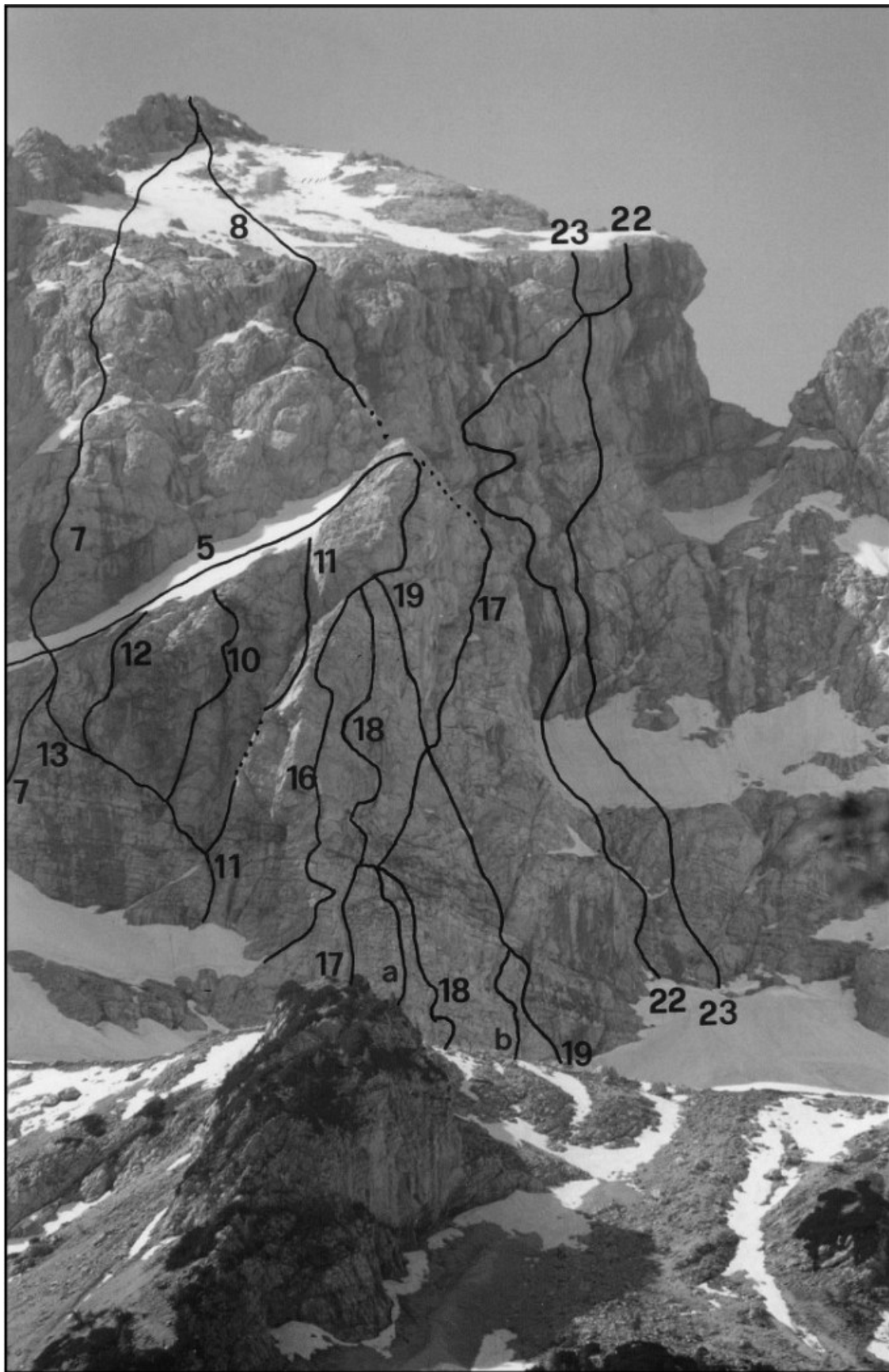
Grintovec: 5 Prečenje severne in severozahodne stene, 8 Smer Saar-Satler, 10 Carmen, 11 Grintovčev steber, 12 Tanjina, 16 Beračica, 17 Košutova spominska smer, 17a Ledena varianta, 17b Desna vstopna varianta, 18 Čarovnik iz Oza, 19 Tomažev steber, 22 Kovkov sindrom, 23 Konkubina.