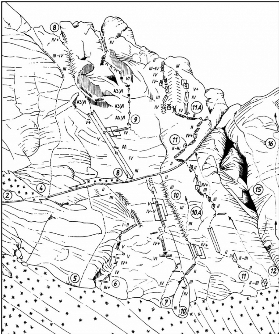
Dolška škrbina: 2 Fuchsova smer, 3 Dijaška, 4 Smer 80, 5 Kolenčkova, 6 Plava, 7 A2, 8 Maturantska, 9 Spominska smer dr. Zavrnik, 10 Centralna smer, 10a Varianta Centralne smeri, 11 Mariborska smer, 11a Varianta krst, 12 Direktna, 13 Diagonala, 14 Gabrova varianta, 15 Psihomazohizem, 16 Izgubljene duše.