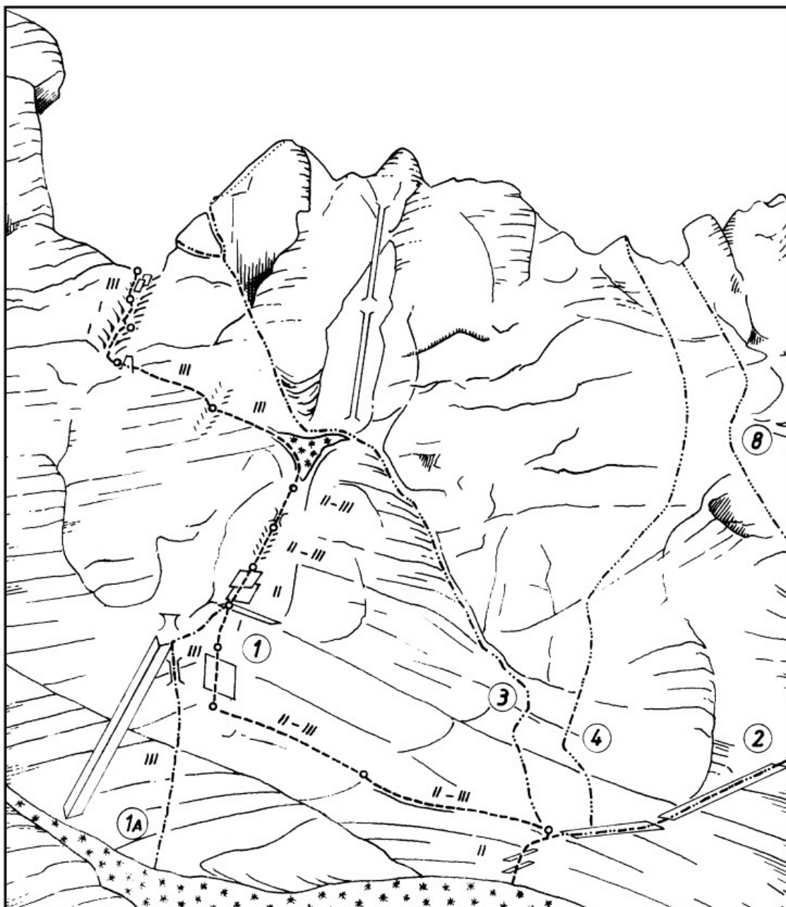
Dolška škrbina: 1 Fritsch-Lindenbach, 1a Vstopna varianta, 2 Fuchsova smer, 3 Dijaška, 4 Smer 80, 8 Maturantska.