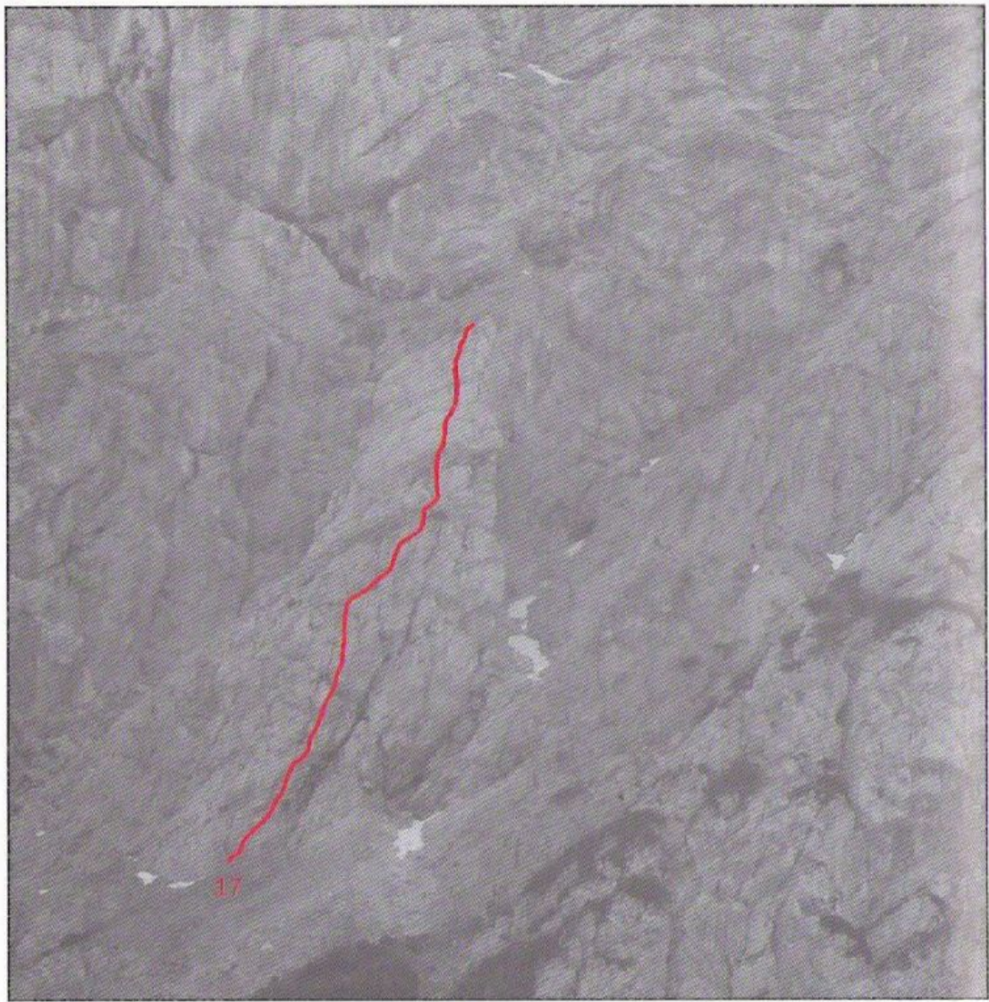
Slika 22 PRISANK, severozahodna stena: 17 Škratov zob.

Prisank, severozahodna stena: 17 Škratov zob.