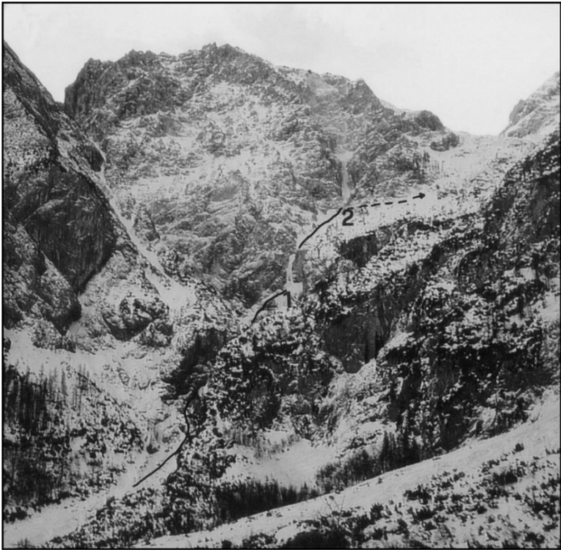
Zaledeneli slapovi: 1 Spodnji Ledinski slap, 2 Zgornji Ledinski slap.