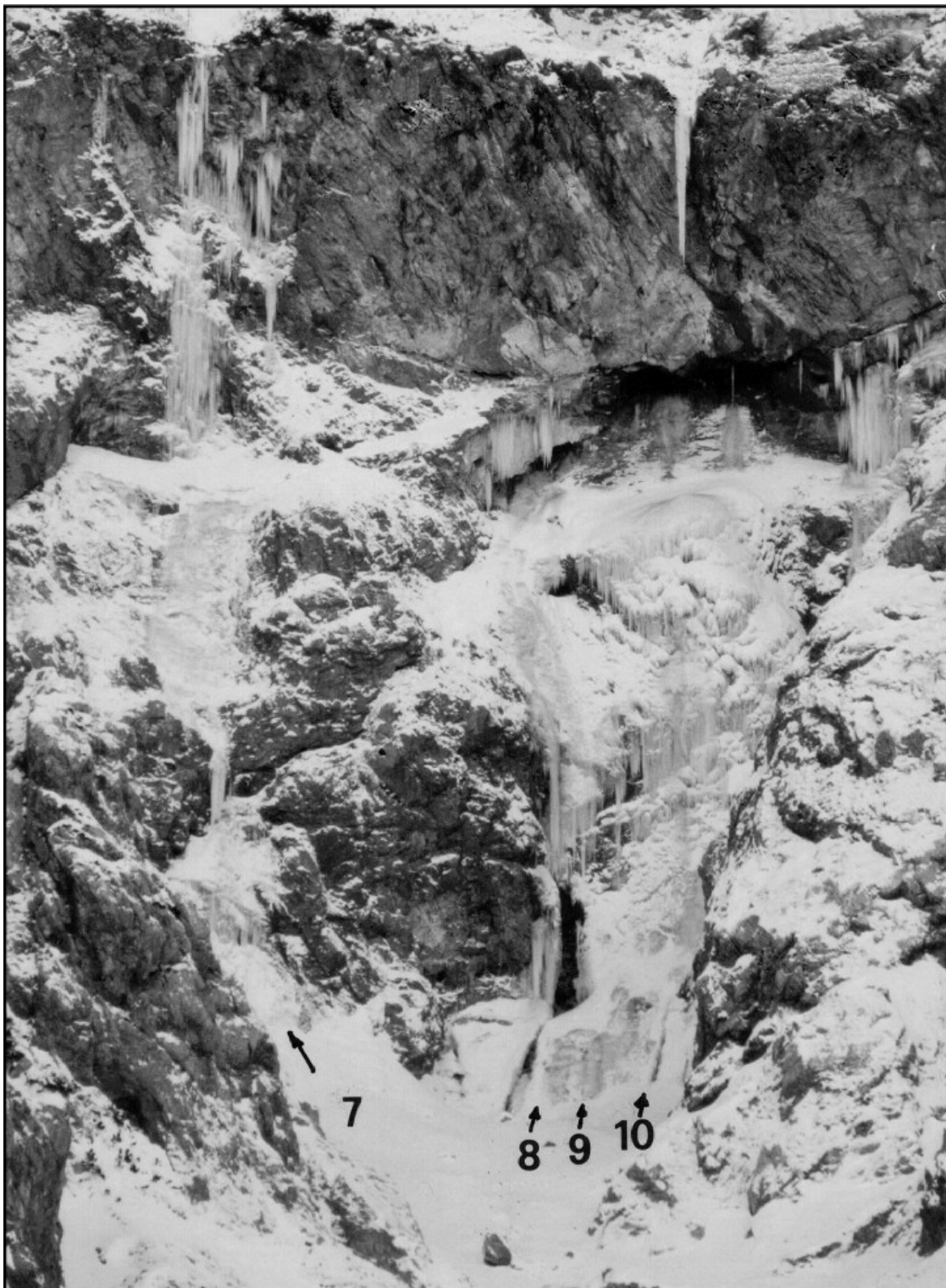
Zaledeneli slapovi: 7 Čedca, 8 Zavesa, 9 Solza za Pubija, 10 Desni krak Čedce.