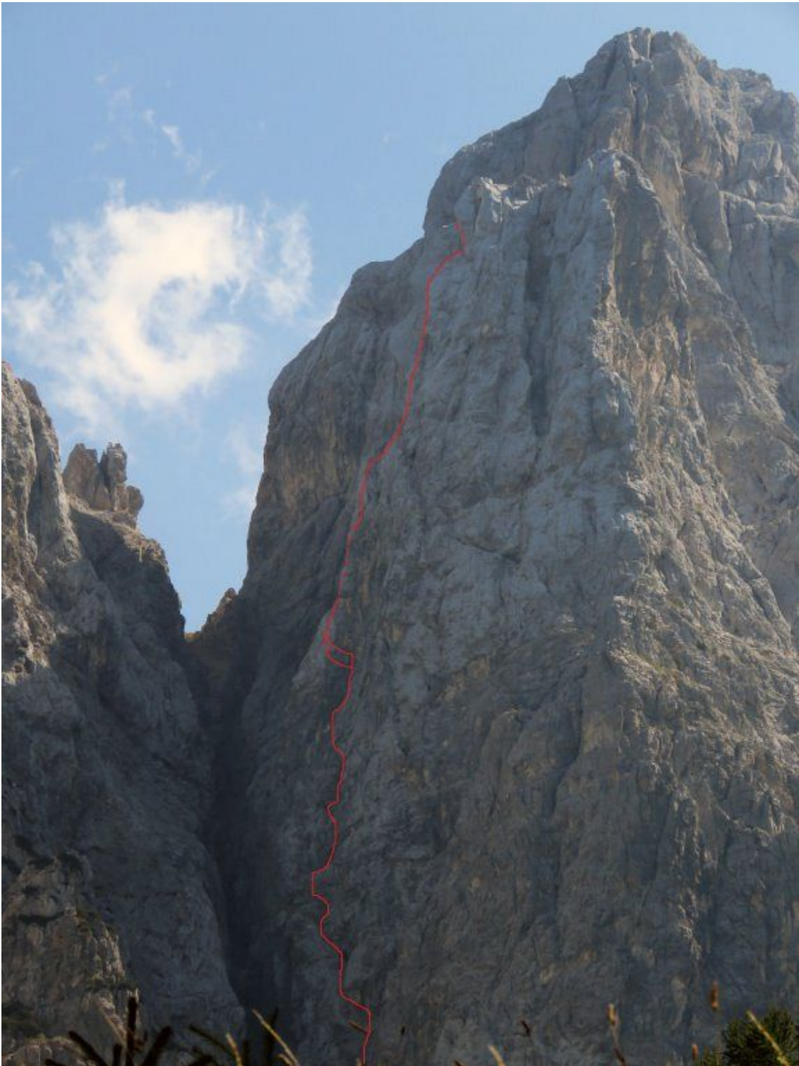
Hudičev steber, severozahodna stena: Bobr (vris).

dosežemo dveh vzporednih poči. Izberemo desno. Po njenem koncu po gredini desno in nato gor čez rahlo previsno poč v lažji svet. Od tu že vidimo vrh. Plezamo naravnost navzgor dva raztežaja v res očitno zajedo/poč. Zadnji raztežaj plezamo popolnoma v kotu proti kaminu po platah do pod strehe. Strehe se izognemo na levo, da dosežemo rob stene.