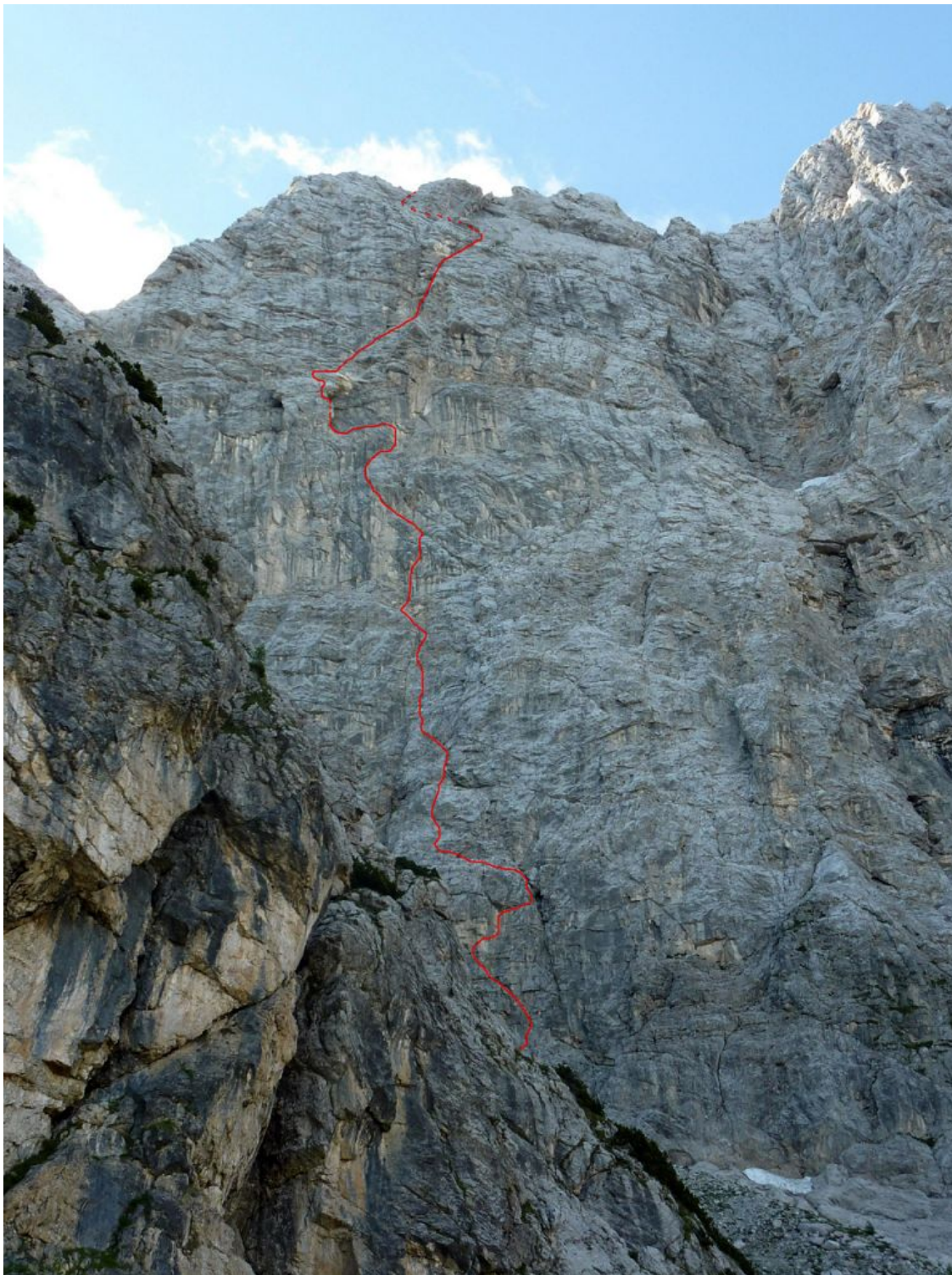
Velika Mojstrovka, severna stena: Žica v uč (vris).