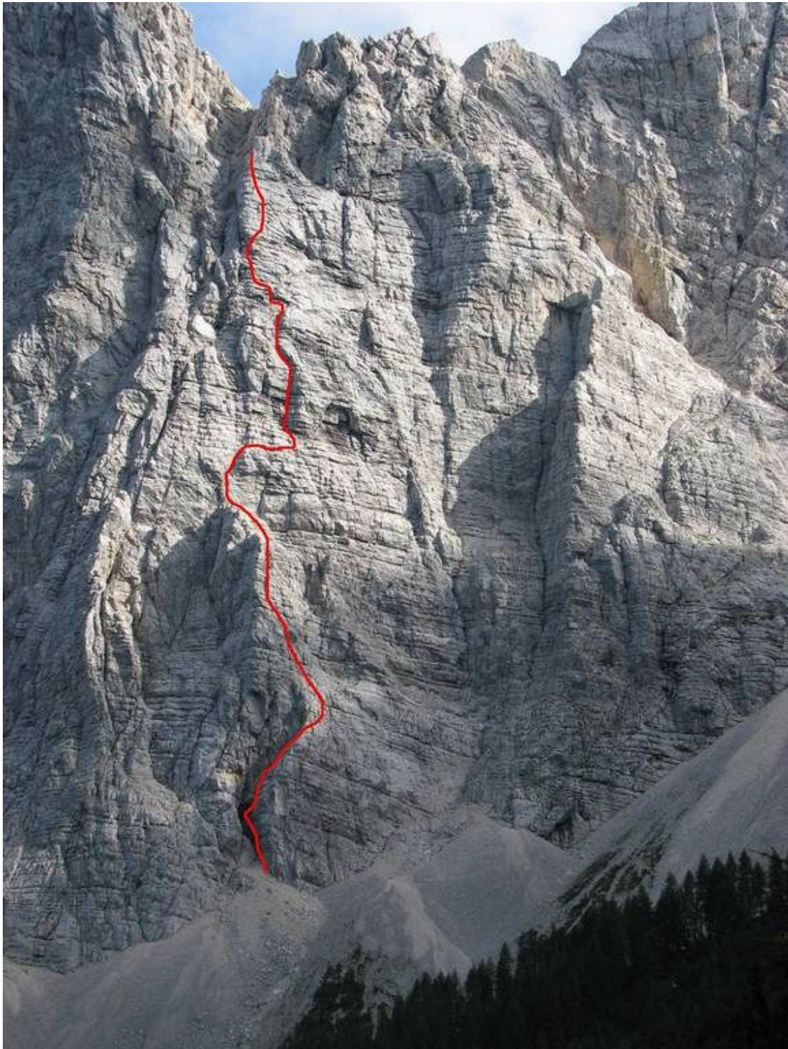
Veliki Draški vrh-Trapez: Lomska smer (vris).