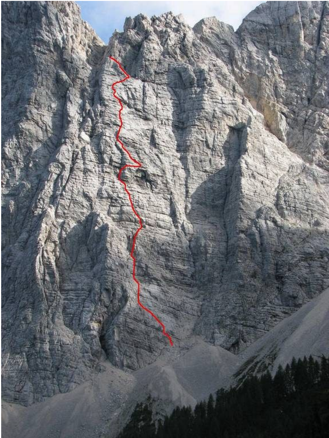
Veliki Draški vrh-Trapez: Slaparska (vris).