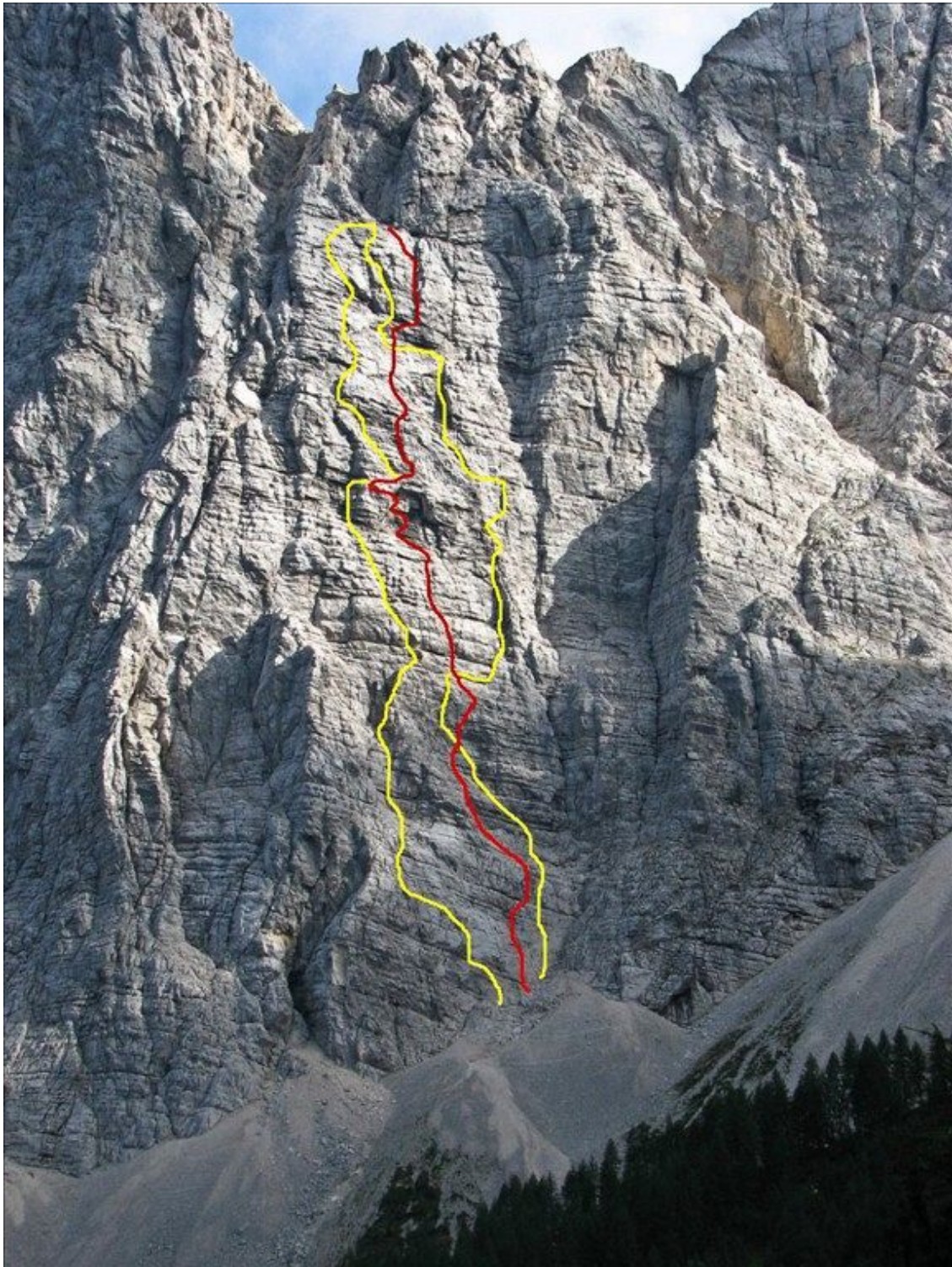
Velki Draški vrh-Trapez: Pot do sonca (smer je vrisana z rdečo).