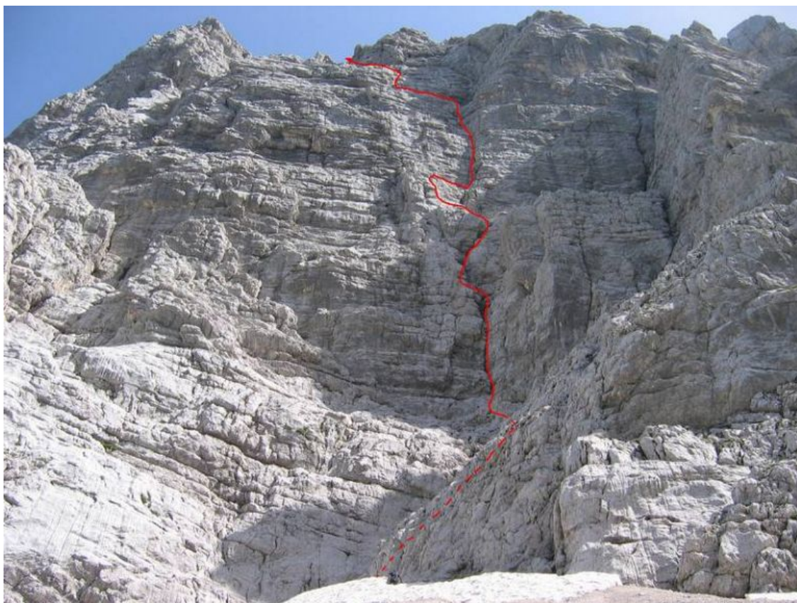
Veliki Draški vrh-Trapez: DKV (vris).

se nekako zbašeš po ozki polički za rob do zadnjega varovališča. Originalnega izstopa najbrž nihče več ne pleza, tako da slediš poševni rampi na vrh stolpa in od tam levo v grapo, ki te pripelje na vrh.