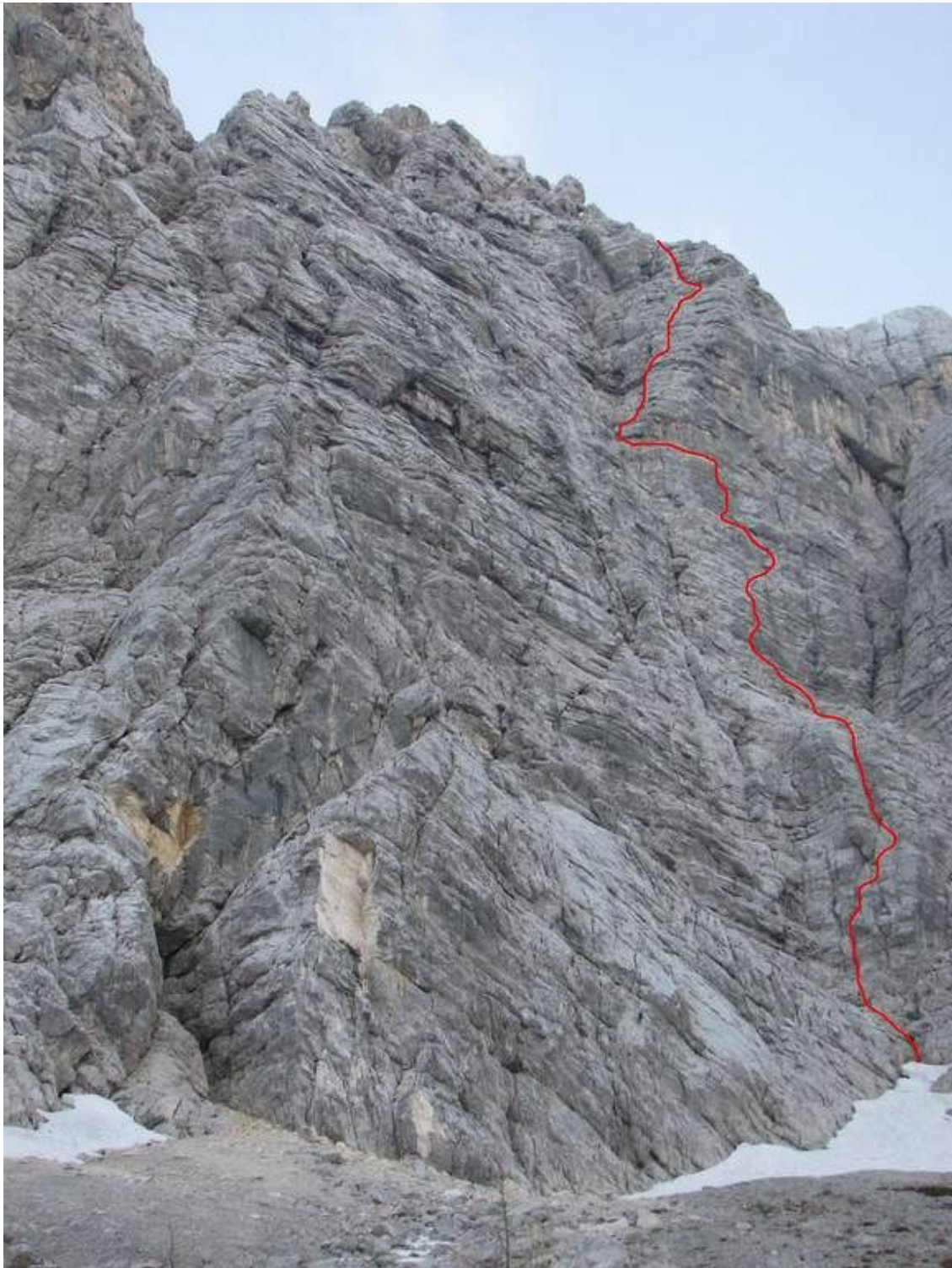
Veliki Draški vrh-Trapez: Črna maša (vris).