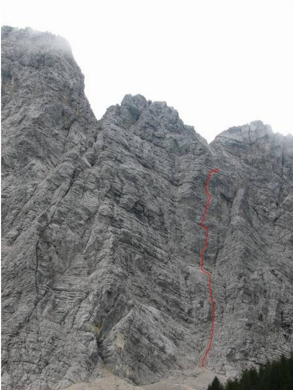
Veliki draški vrh-Trapez: Tržiška (vris).