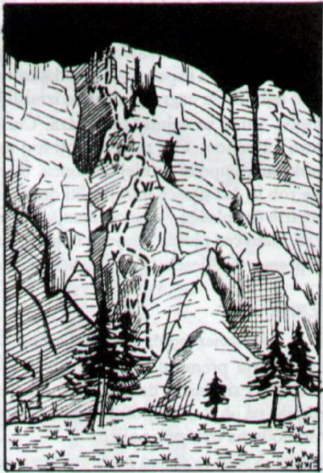
Velika Mojstrovka, severna stena: Strah pred letenjem (skica).