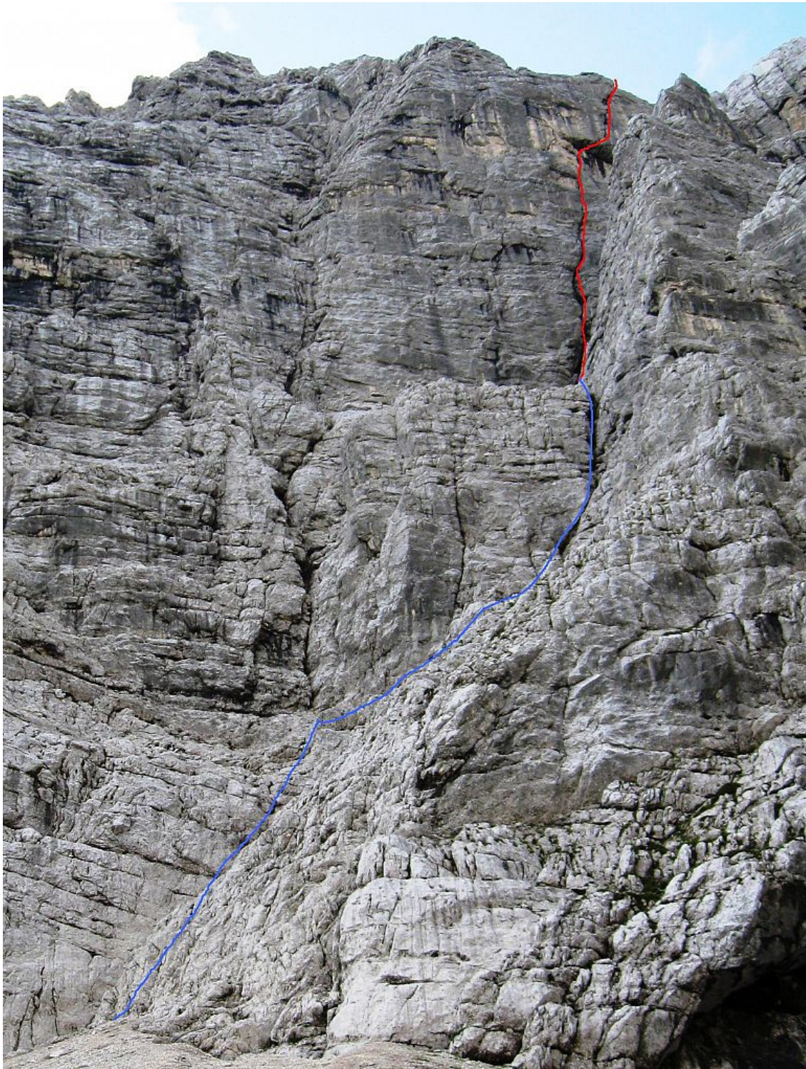
Veliki Draški vrh-Trapez: Nebeška streha (vris).