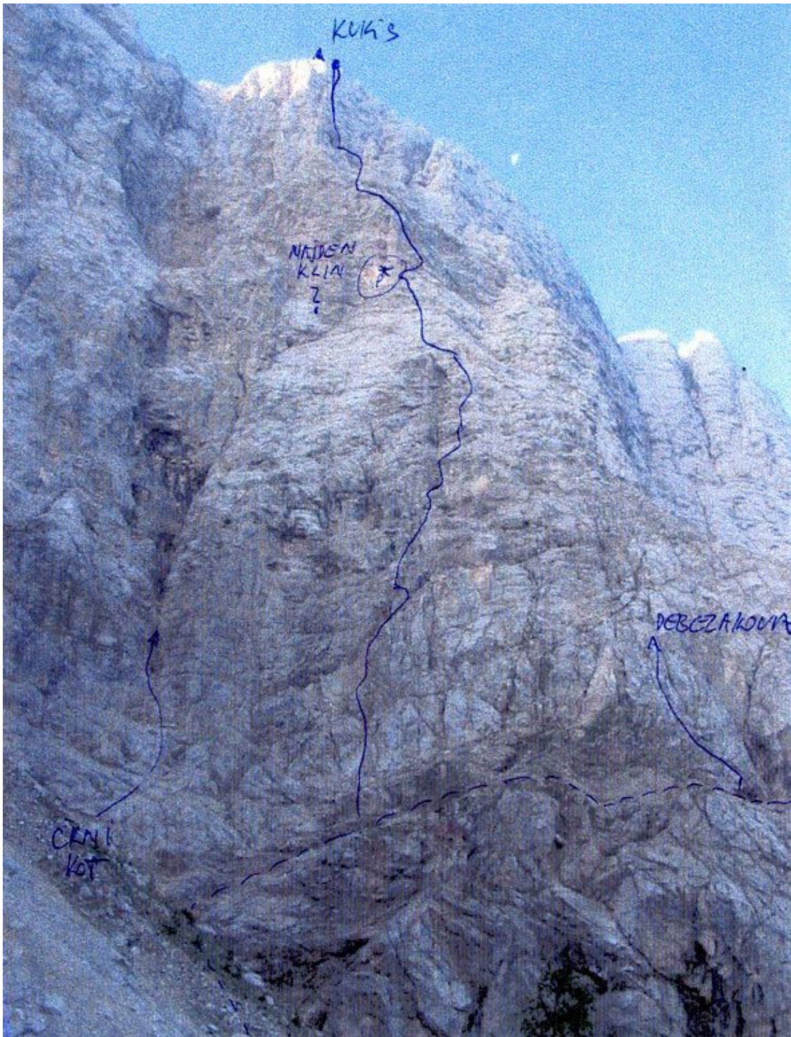
Velika Mojstrovka, severna stena: Kukis, Smer Debelakove, Črni kot (vris).