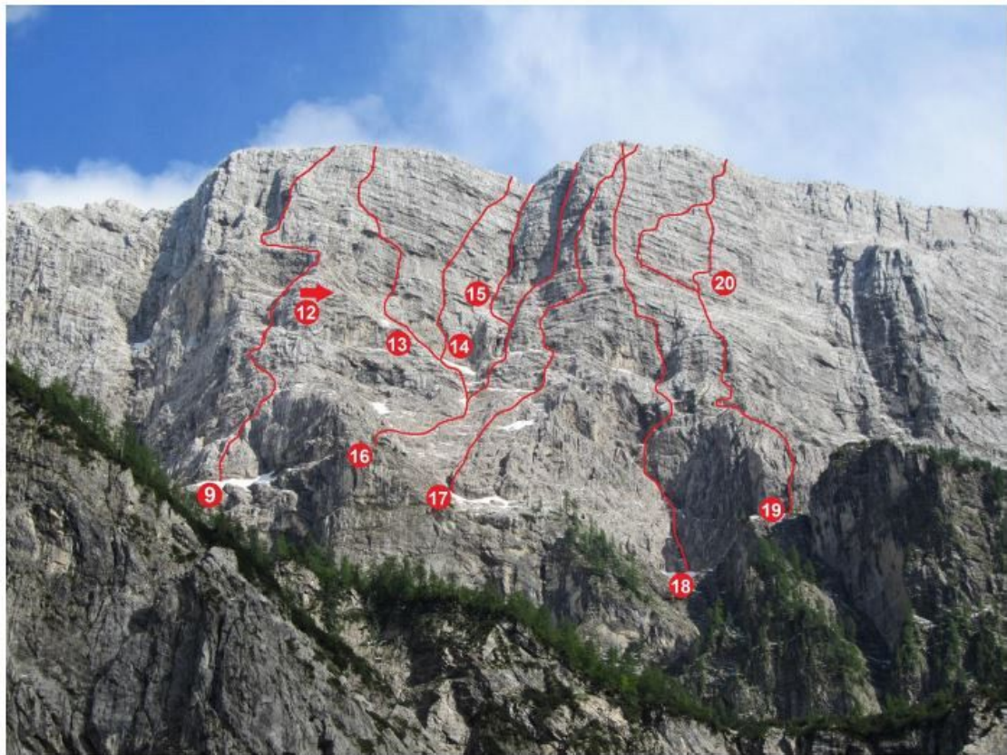
9 Smer Debelakove, 12 Pekovske plate, 13 Thunder, 14 Benkovič, 15 Zajeda Krivic-Komac, 16 Kaminska smer, 17 Steber revežev, 18 Nos, 19 Dular-Schara, 20 Varianta Dular-Schara.