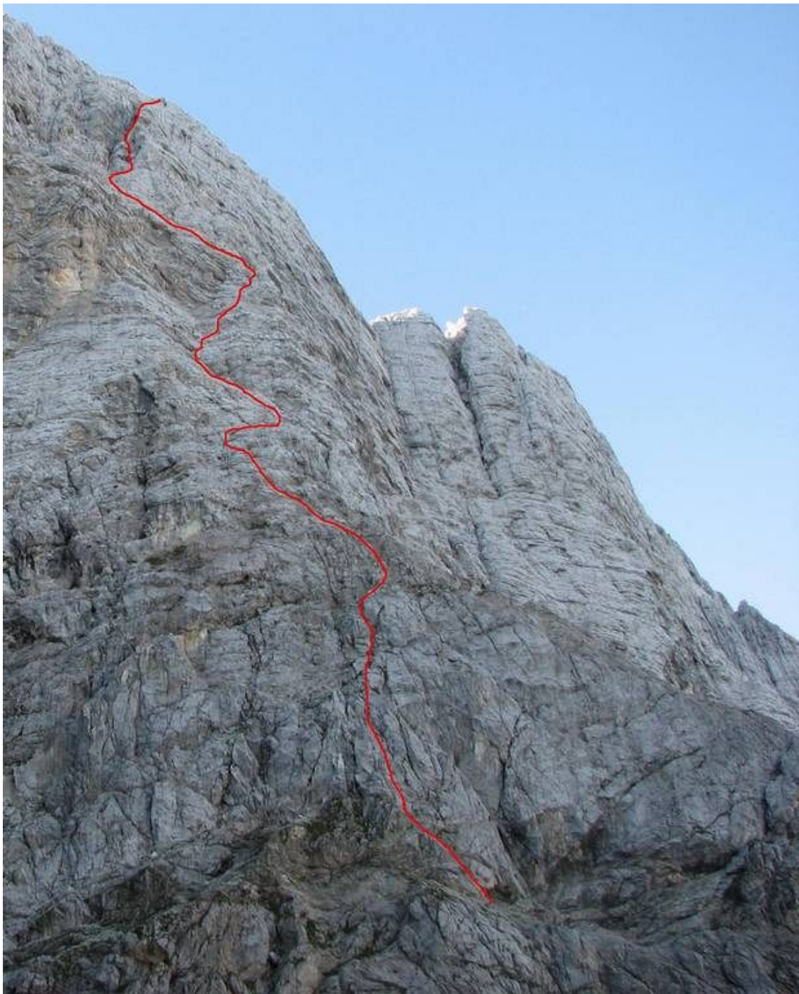
Velika Mojstrovka, severna stena: Smer Debelakove (vris).