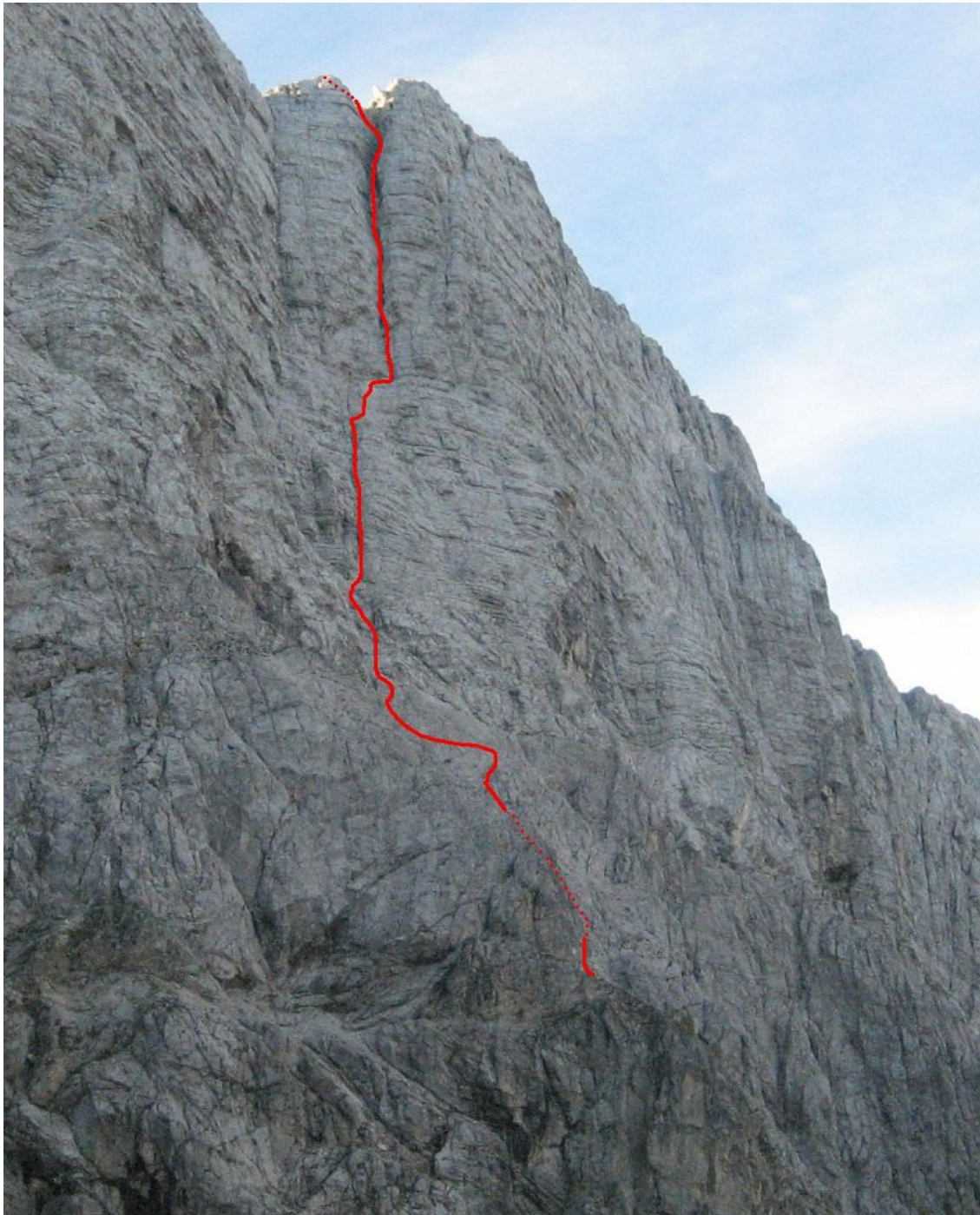
Velika Mojstrovka, severna stena: Kaminska smer (vris).