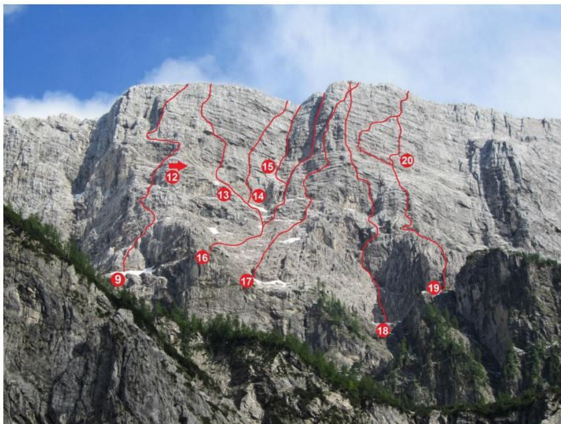
9 Smer Debelakove, 12 Pekovske plate, 13 Thunder, 14 Benkovič, 15 Zajeda Krivic-Komac, 16 Kaminska smer, 17 Steber revežev, 18 Nos, 19 Dular-Schara, 20 Varianta Dular-Schara.

Velika Mojstrovka, severna stena: Kaminska smer (skica).