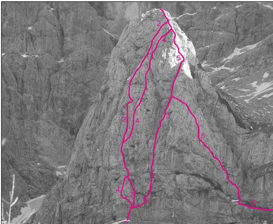
Turn, severozahodna stena: 2 Rašiška smer, 3 Škofovska smer, 4 V Ieru, 5 Desna smer.