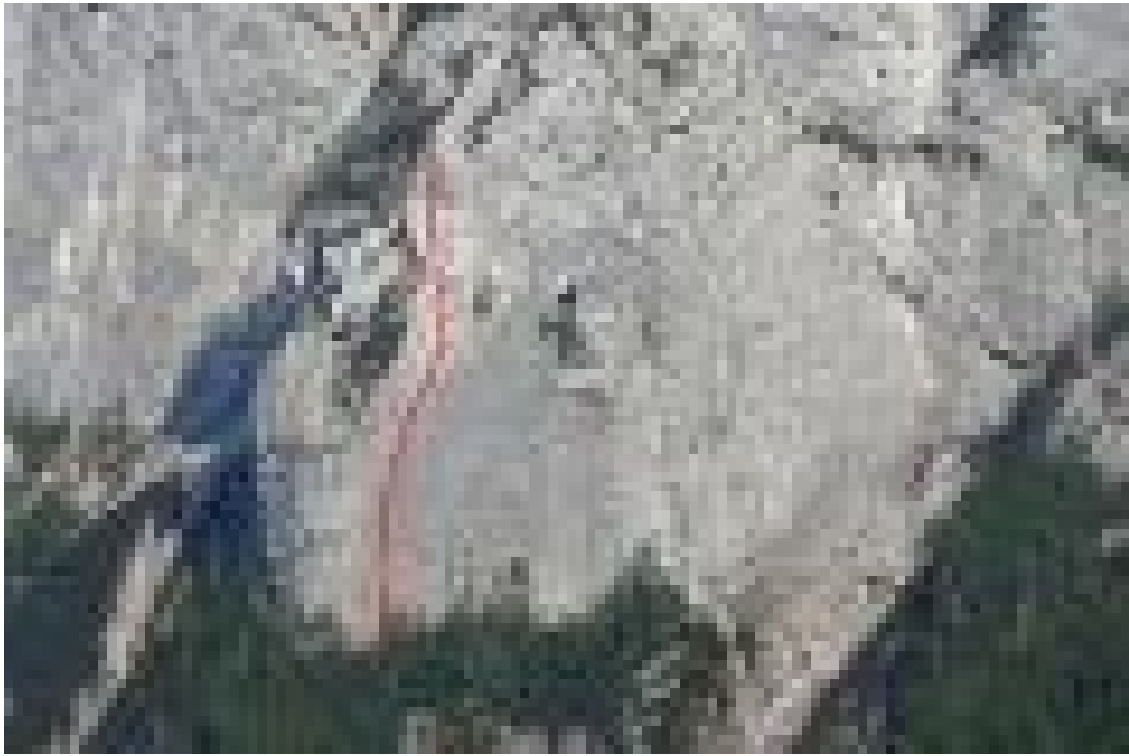
Posmeh sivini (vris).