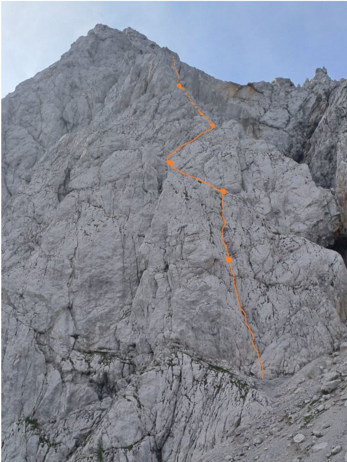
Šepet vetra vris