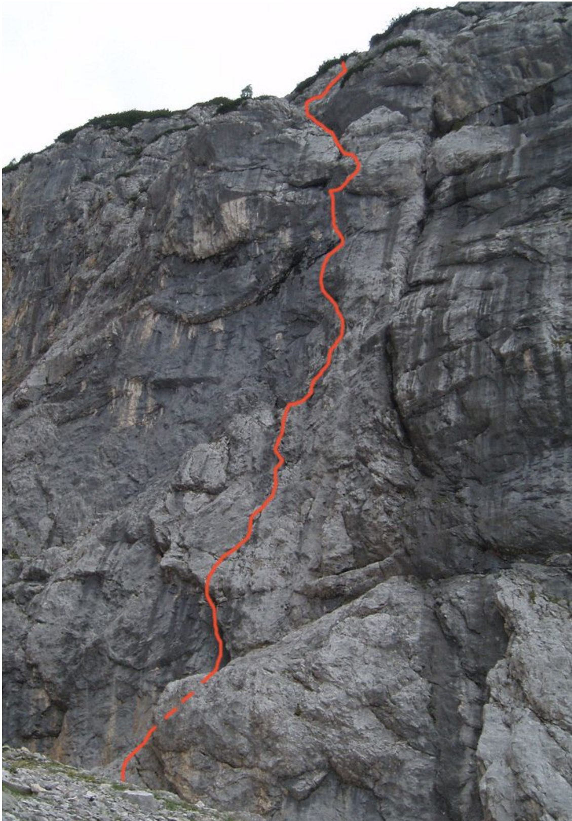
Rušica, južna stena: Levi pas (vris).