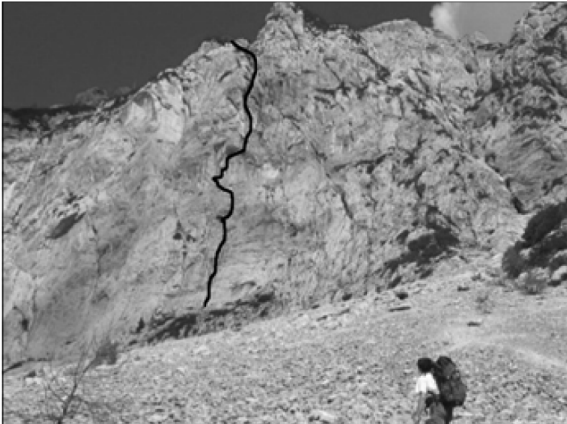
Rušica, južna stena: Žamarjeva smer (vris).