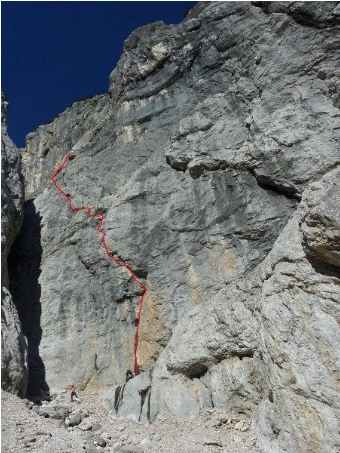
Rušica, južna stena: MiMaHla (vris).