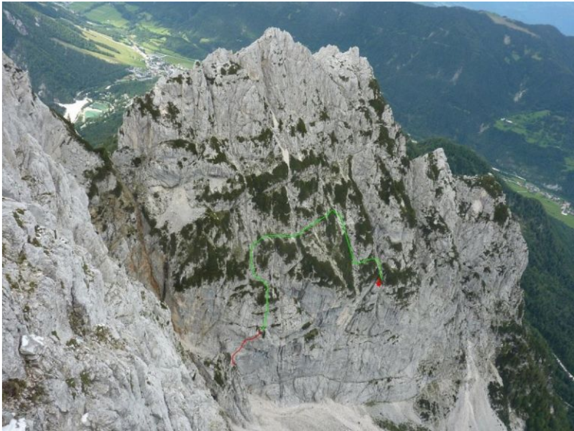
Rušica, južna stena: MiMaHla (vris 2)